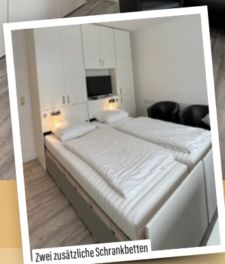
Zwei zusätzliche Schrankbetten