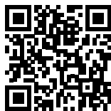
Anfahrt mit GoogleMaps

A 31 (aus Richtung Süden kommend) · Emden-Nord (Abfahrt 3) · B 210 und B 72 (ab Georgsheil) in Richtung Norden/Norddeich · in Norddeich per Fähre zur Insel Norderney · ab Norderney-Hafen per Bus (Linie 1) bis Haltestelle Haus Waldeck oder per Taxi bis zur Haustür